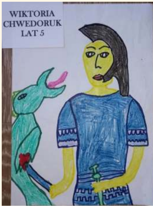
WIKTORIA CHWEDORUK LAT 5