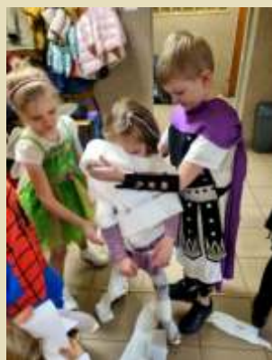
Było super! Cała galeria zdjęć na Facebooku.