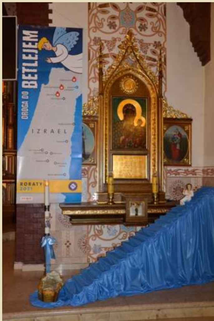
Roraty 2021 w naszej parafii